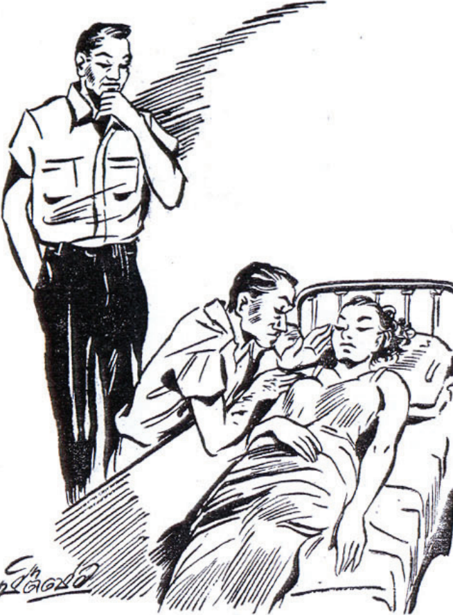
"ඔහු ඇද ලග දණ ගසාගෙන අඹන වෙලේ ඇනාගේ තරුණ පෙම්වතා ද වෙයි. ඔහුට සමා වන ලෙස ඇනා සැමියාගෙන් අස දිය".

අපට කෙටි කතාවකින් වරිත කක් සම්පූර්ණ වශයෙන් හඳුනා